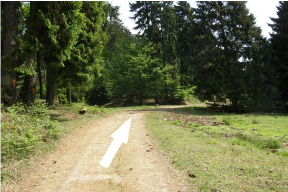
17.) dem Hauptweg folgen