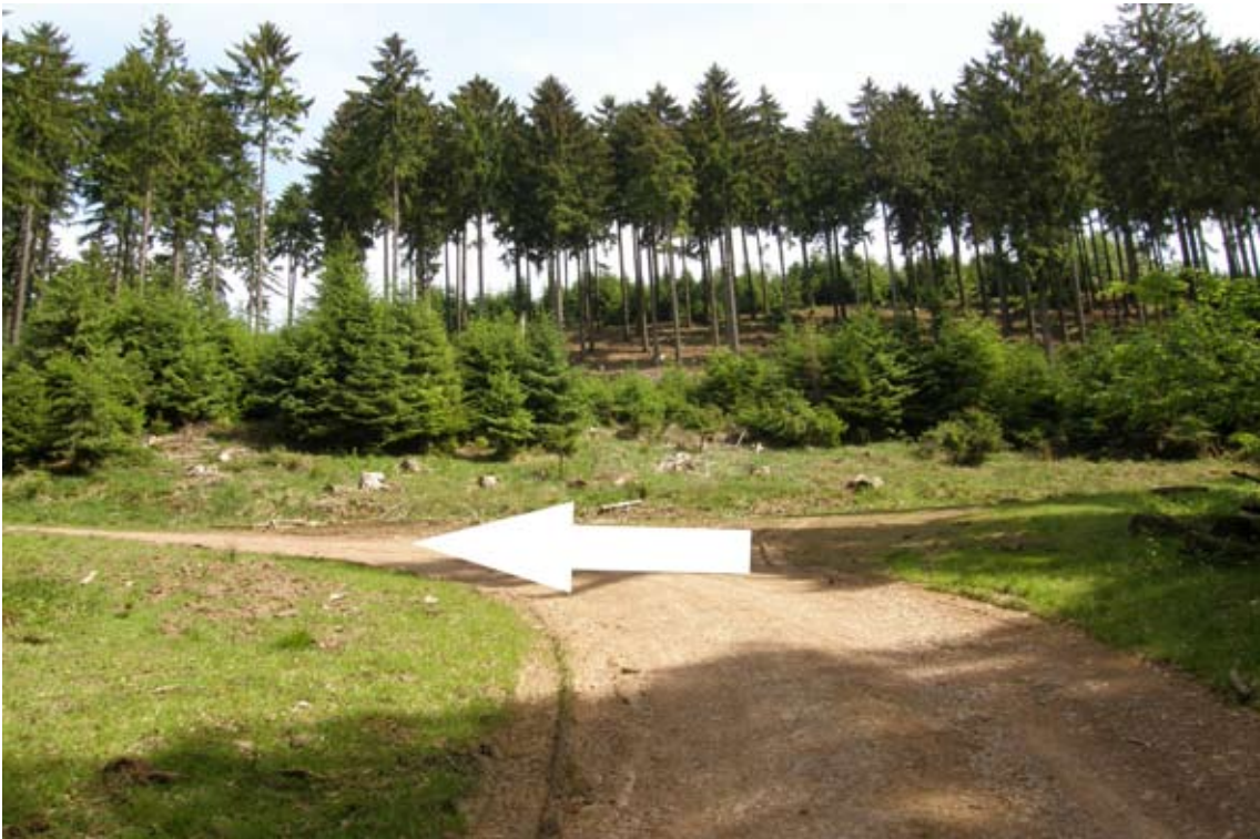
18.) an T-Kreuzung dem Hauptweg links abbiegend folgen