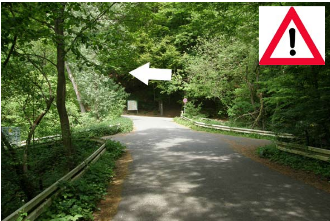
28.) links auf den Wanderparkplatz