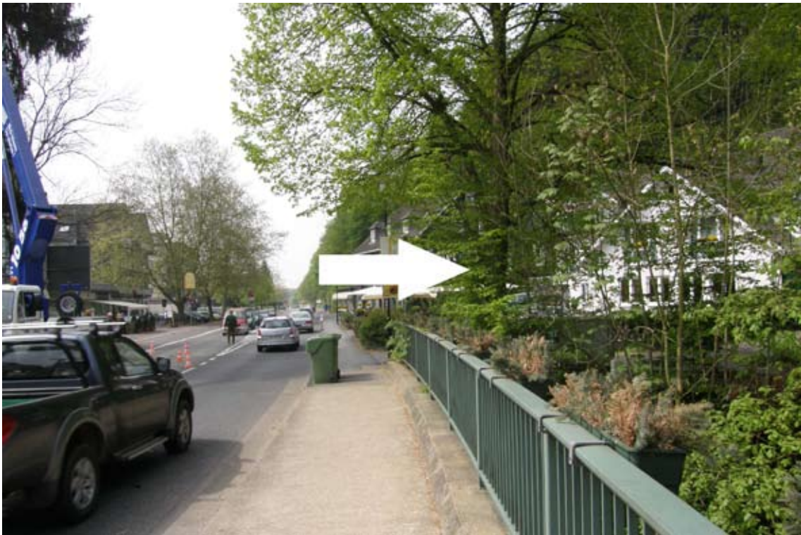
5.) gleich hinter Dhünn-Brücke rechts zum Blumengeschäft