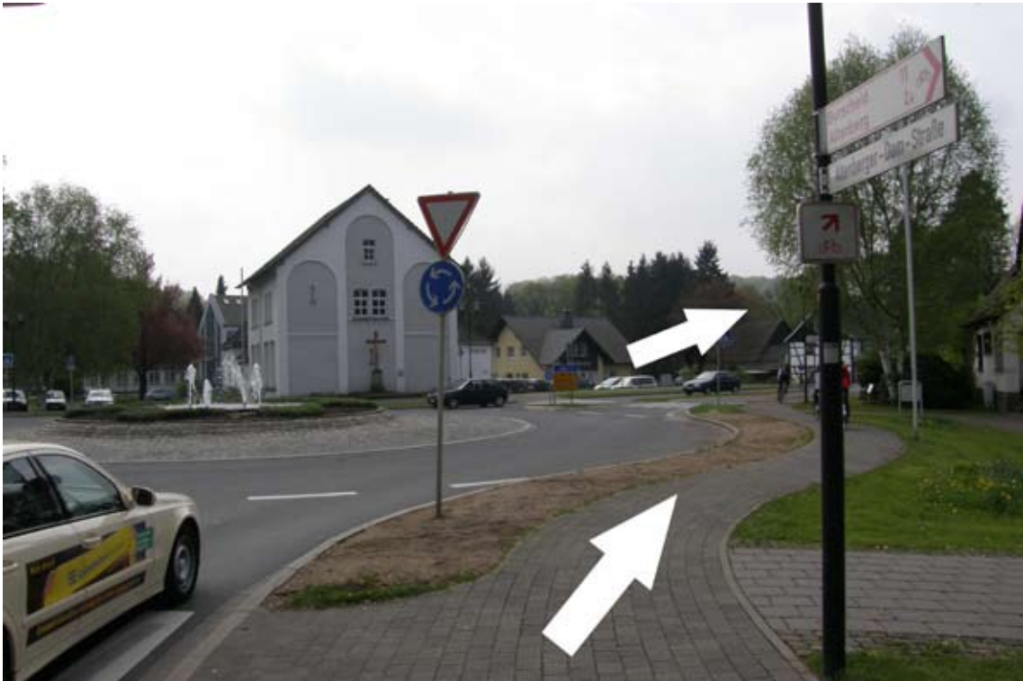
4.) rechts am Kreisverkehr vorbei (einfach auf dem Fußweg bleiben)