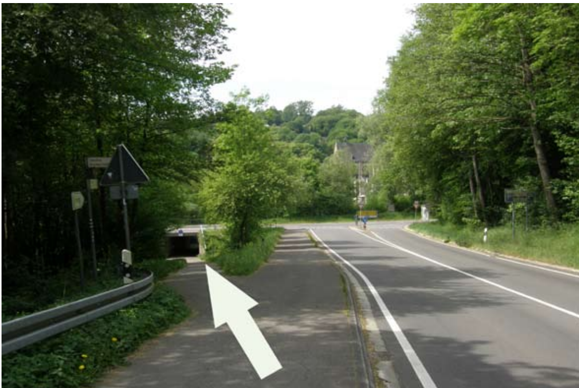
30.) durch die Unterführung zum Dom