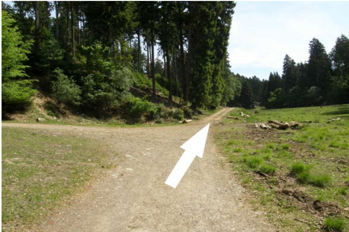
16.) an Gabelung auf großer Lichtung gerade- aus - optimaler Pausenplatz