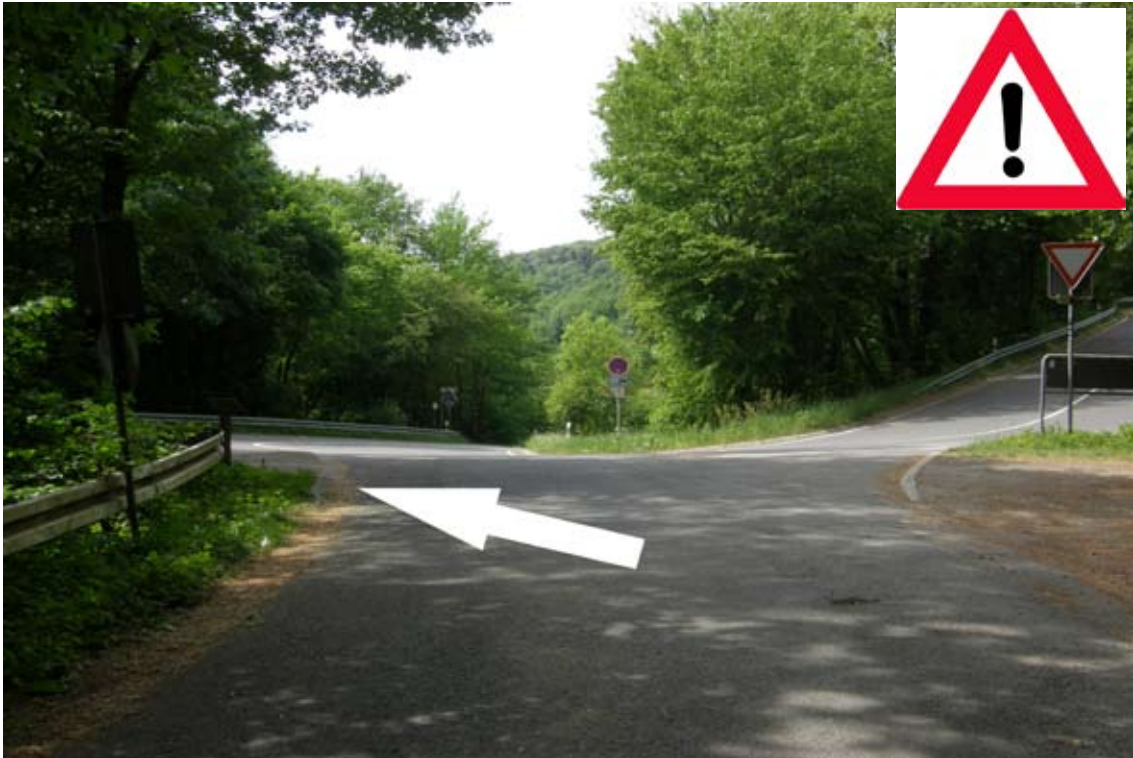
29.) vom Parkplatz links den Fußweg nehmen