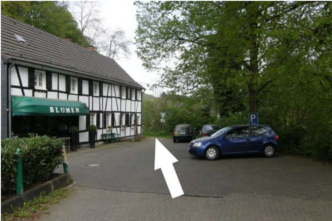
6.) rechts am Blumengeschäft beginnt ein Wanderweg; diesem folgen (führt an mehreren Häuschen vorbei)