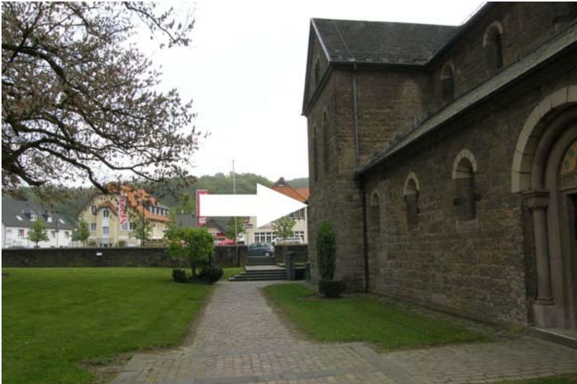
2.) links um die Kirche herum (vom Portal aus gesehen) zur Hauptstraße