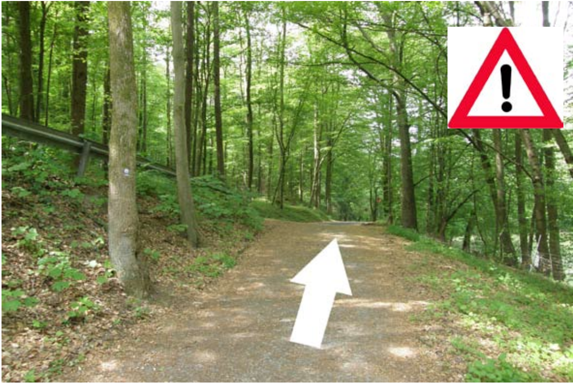
27.) den Fahrweg weiter