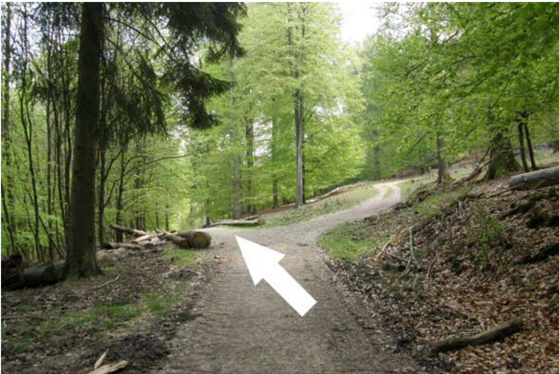
15.) an Gabelung halb links