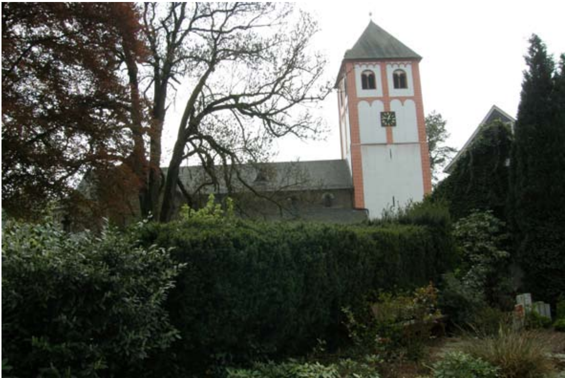
1.) Kirche von Norden aus gesehen