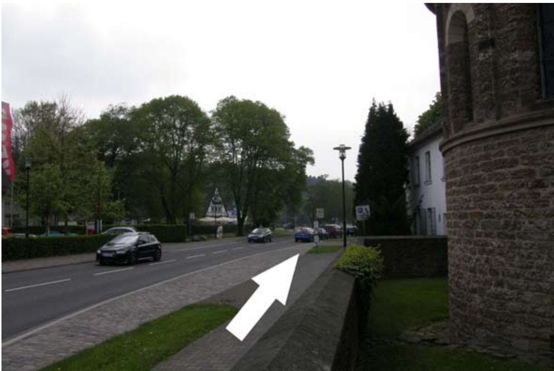
3.) an der Straße rechts Richtung Kreisverkehr