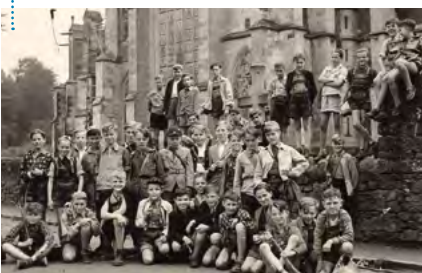
Ausflug zum Altenberger Dom, 1953

Zugegeben, das Thema überraschte. Wir wollen uns doch gerade mit unseren zielgruppengenauen Angeboten für Kinder, Jugendliche und junge Erwachsene profilieren und Freiräume für sie entwickeln. Und jetzt sollen wir auf einmal doch mit den ›Alten‹ kooperieren?