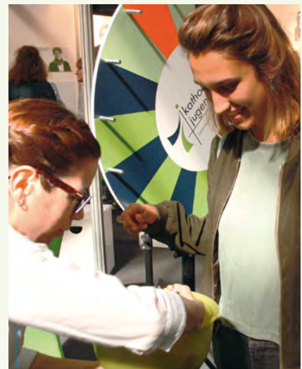
Ein Dreh am KJA-Glücksrad brachte immer einen Gewinn ein und bot häufig den Einstieg in spannende Gespräche und Begegnungen.