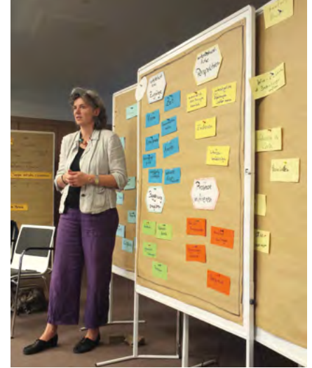
Kirchliche Jugendarbeit früher und heute - Fotos und der Austausch über Erlebnisse aus unterschiedlichen Zeiten bieten einen ersten Zugang zum Thema.

»Die Kirche bietet grundsätzlich Raum für die Begegnung von Menschen aus allen Generationen. In den Gemeinden wird gerne über fehlenden Nachwuchs geklagt. Dabei könnte eine Arbeit über Generationen hinweg dabei helfen, gezielte Talentförderung für junge Menschen zu betreiben. Auch dort, wo Ältere lang erworbene Positionen in Gremien und Vereinen innehaben und Jüngere in der Regel nicht nachrücken, ist die intergenerationelle Arbeit eine Chance, ein ungehobener Schatz mit viel Potenzial.«