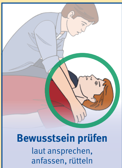
Bewusstsein prüfen laut ansprechen, anfassen, rütteln