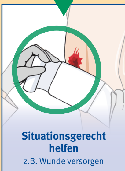
Situationsgerecht helfen z.B. Wunde versorgen