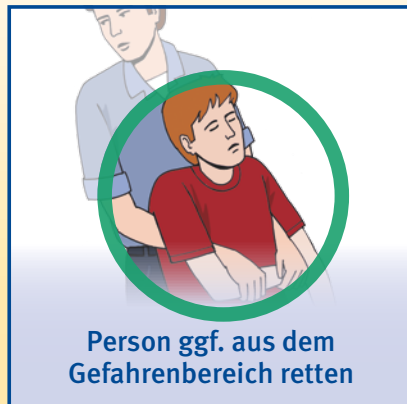
Person ggf. aus dem Gefahrenbereich retten